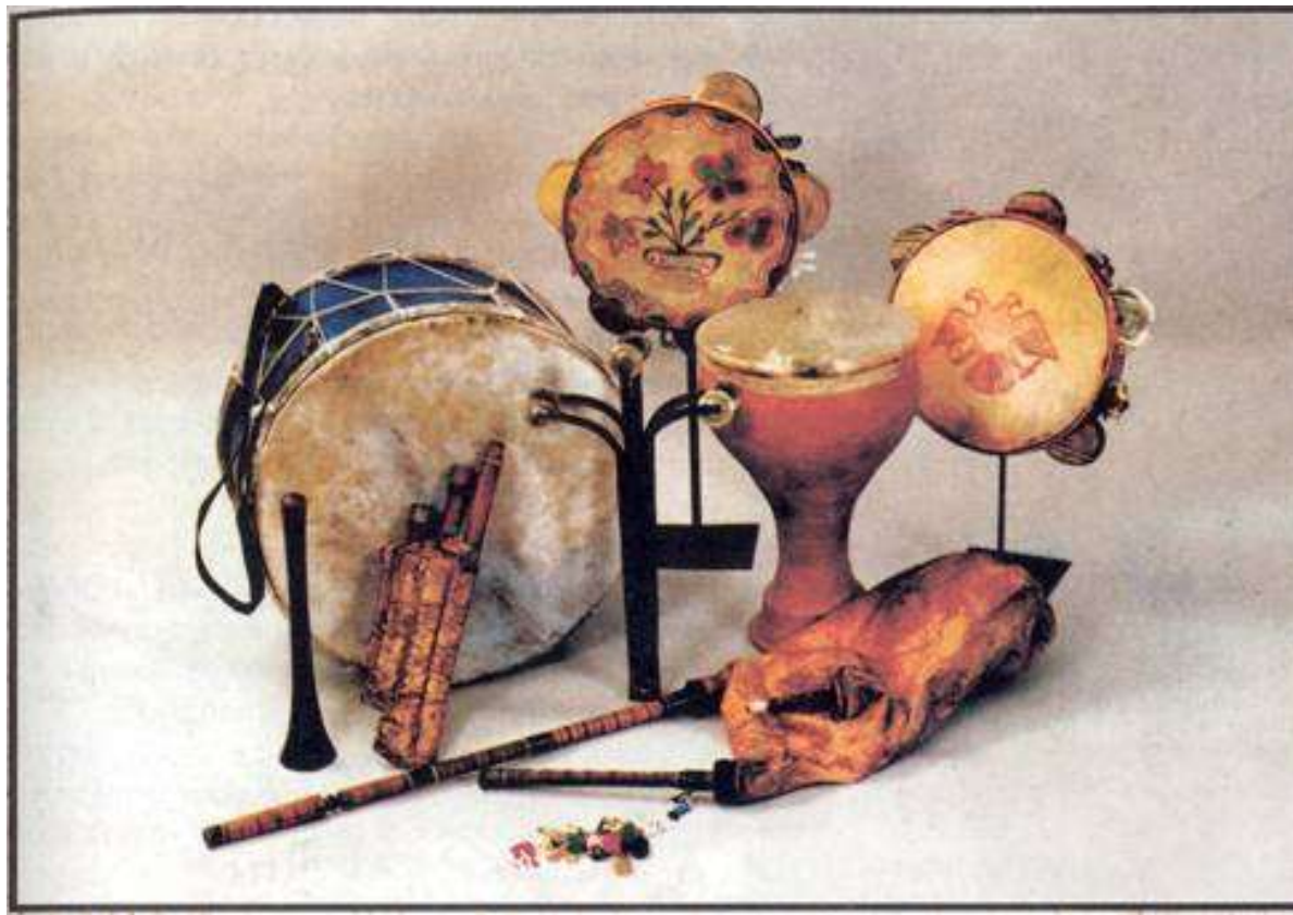
Ζουρνάς Νταούλι Γκάνιντα Τουμπελέκι Ντέφι